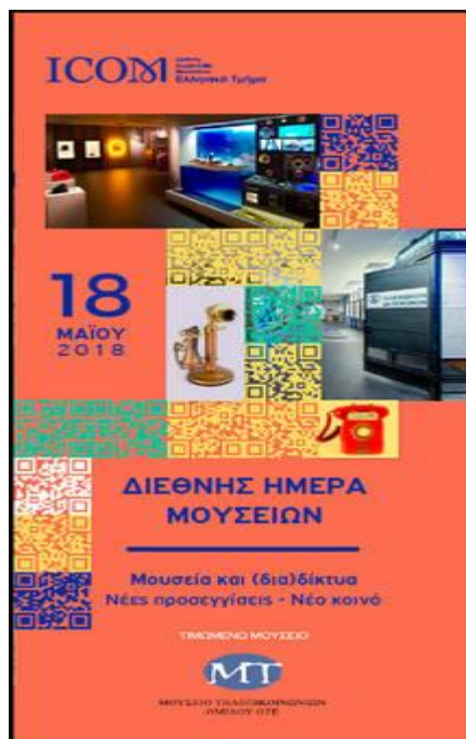
Εικόνα 2: Η αφίσα για τη Διεθνή Ημέρα Μουσείων 2018