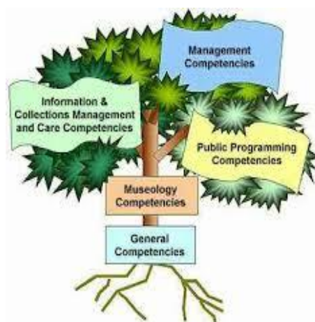
Εικόνα 1: Οι κατευθυντήριες γραμμές του ICOM για την ανάπτυξη του επαγγελματισμού στα μουσεία