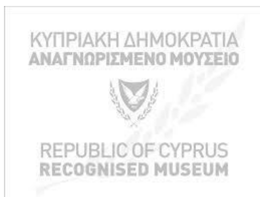
Εικόνα 3: Το σήμα της Κύπρου για τα αναγνωρισμένα μουσεία

Το Υπουργείο Παιδείας και Πολιτισμού της Κύπρου, επιχειρώντας το 2004 να χαρτογραφήσει το μουσειακό τοπίο της χώρας, πραγματοποίησε μία έρευνα, σύμφωνα με την οποία στη χώρα λειτουργούσαν ως ιδιωτικά μουσεία 56 χώροι, με τα περισσότερα από αυτά να μην πληρούν τις προϋποθέσεις του ICOM για τα μουσεία. Ο νόμος του 2009 ενσωμάτωσε τις αρχές των διεθνών οργανισμών για τη μουσειακή πολιτική και έθεσε τις βάσεις για την αναβάθμιση του μουσειακού τομέα. Το 2011 ξεκίνησε η διαδικασία ενημέρωσης των μουσείων για την αναγνώριση και οι πρώτες αιτήσεις υποβλήθηκαν το 2013. Παρά το ενδιαφέρον εκ μέρους των ιδιωτικών μουσείων, μέχρι σήμερα έχουν λάβει πιστοποιητικό αναγνώρισης μόνο τέσσερα μουσεία, γεγονός που καταδεικνύει τη δυσκολία εφαρμογής κάθε νέας πολιτικής (Νικολάου, 2016).