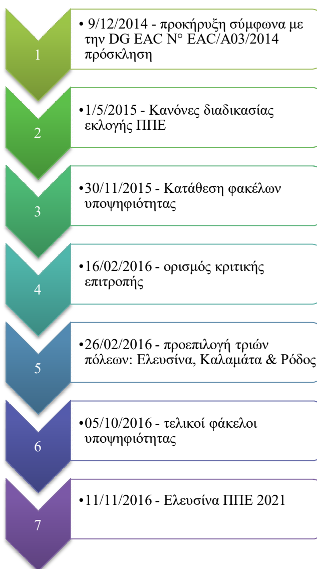
Εικόνα 1: Το χρονικό της ανακήρυξης της ΠΠΕ 2021

Οκτώ μήνες αργότερα, στις 05/10/2016, οι τρεις υποψήφιες πόλεις κατέθεσαν τους αναθεωρημένους φακέλους αίτησης υποψηφιότητας και έναν μήνα αργότερα στις 11/11/2016, ο πρόεδρος της κριτικής επιτροπής Steve Green ανακήρυξε την Ελευσίνα ως ΠΠΕ για το 2021 (ecoc2021, 2016α). Το δελτίο τύπου της Ευρωπαϊκής Επιτροπής για την ανακήρυξη της Ελευσίνας την ίδια