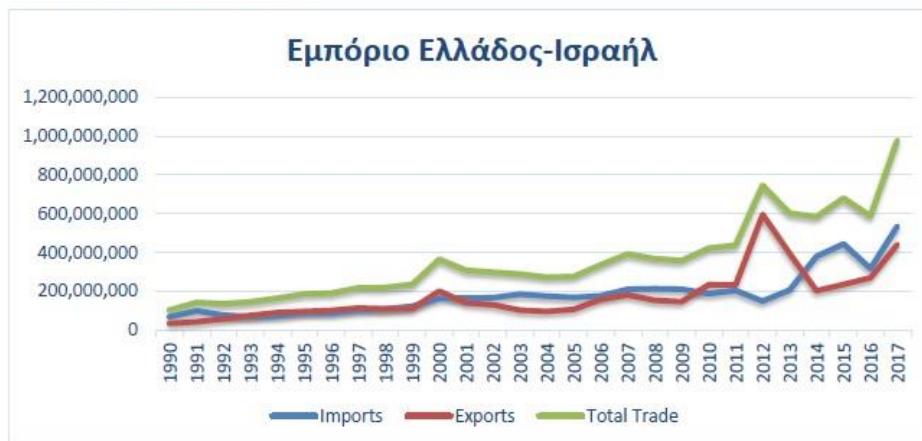
Γράφημα 1: Εμπόριο Ελλάδος-Ισραήλ