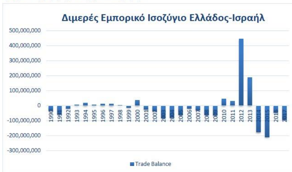
Γράφημα 2: Διμερές Εμπορικό Ισοζύγιο Ελλάδος-Ισραήλ