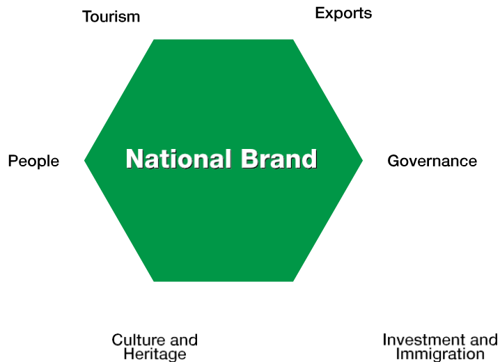
Εικόνα 2 Το εξάγωνο του Nation-brand© 2000 Simon Anholt,.

Πρόκειται για την περίπτωση κατά την οποία οι κυβερνήσεις μπορούν να εγκαθιδρύσουν κράτος δικαίου, ένα ελκυστικό περιβάλλον για μετανάστευση και επιχειρηματικότητα και να υποστηρίξουν επενδύσεις στην τέχνη και τον πολιτισμό με ενίσχυση του διεθνούς ενδιαφέροντος. Το nation brand ουσιαστικά συμβάλλει στην προώθηση των εθνικών προτεραιοτήτων μέσω προγραμμάτων δημόσιας διπλωματίας και λοιπών δραστηριοτήτων.