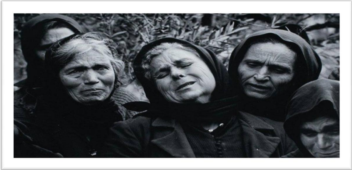
Εικόνα 1. Μοιρολογίστρες