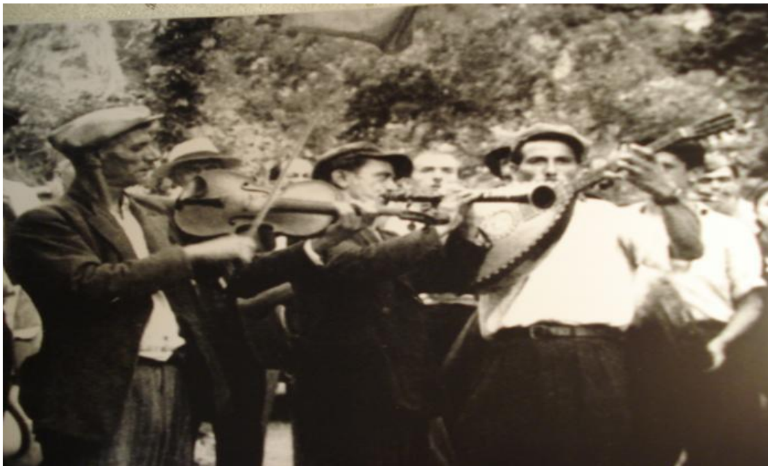
Εικόνα 3 – Παραδοσιακή Ηπειρώτικη Κομπανία με Κλαρίνο, Βιολί, Λαούτο και Ντέφι.

Φυσικά, πολλές φορές τα όρια αυτών των τραγουδιών δεν είναι στενά, έτσι μπορεί να συναντήσουμε ένα ηπειρώτικο μοιρολόι με πολλές διαφορετικές μορφές και εκτελέσεις, όπως για παράδειγμα τη «Μαριόλα», ένα από τα διασημότερα ηπειρώτικα μοιρολόγια με θέμα τον θάνατο και τον έρωτα, το οποίο το συναντάμε τόσο ως πολυφωνικό