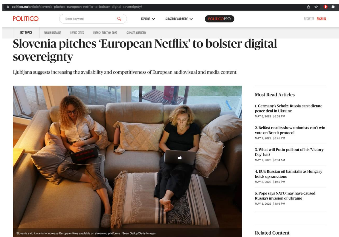
Εικόνα 3: Άρθρο στο Politico 1